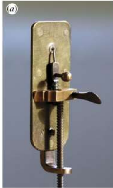
Рис. 3. Репликация микроскопа А. Левенгука. 44