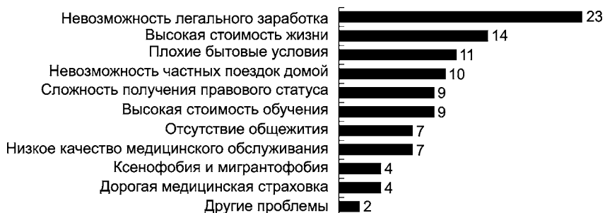
Рис. 3. Наиболее актуальные проблемы иностранных студентов в России (результаты опроса экспертов), % опрошенных 32

Для большинства студентов основными источниками существования являются помощь родителей, стипендия и заработная плата, получаемая в местах дополнительной работы. По мнению 7% экспертов, вопрос о занятости иностранных студентов, которые, согласно российскому законодательству, не имеют права работать за пределами своих учебных заведений, однако вынуждены это делать в силу различных жизненных обстоятельств, в настоящее время абсолютно не решен. Особенно актуальным он является для иностранных предпринимателей и трудовых мигрантов, которые могли бы приносить дополнительные экономические выгоды государству, обучаясь на вечерних и заочных отделениях, курсах повышения квалификации и т.д.