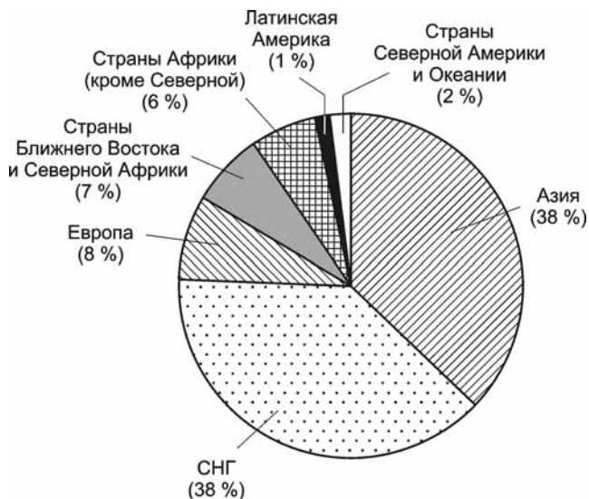
Рис. 2. Распределение иностранных студентов, обучавшихся в России в 2007/08 учебном году, по регионам происхождения 25

а также Малайзия (2,5 тыс. человек) и Корея (2,1 тыс. человек) 23 . Интересен и тот факт, что 93% индийских студентов обучаются в России медицинским специальностям 24 , что отчасти является отражением достаточно серьезных требований к студентам, желающим получить соответствующее образование в США, Канаде, Австралии, Великобритании (в частности, отсутствие возможности продолжения обучения из-за несовпадения методик обучения и значительной разницы в уровне развития медицины).